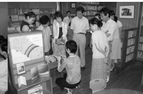
ワークショップ風景