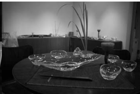
透明な作品たちです