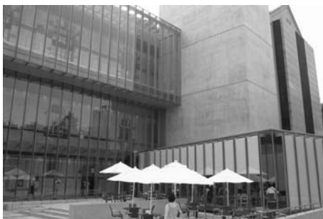
みなさん！応援してくださいね。東洋大