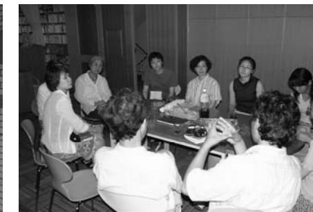
東京子ども図書館 児童室