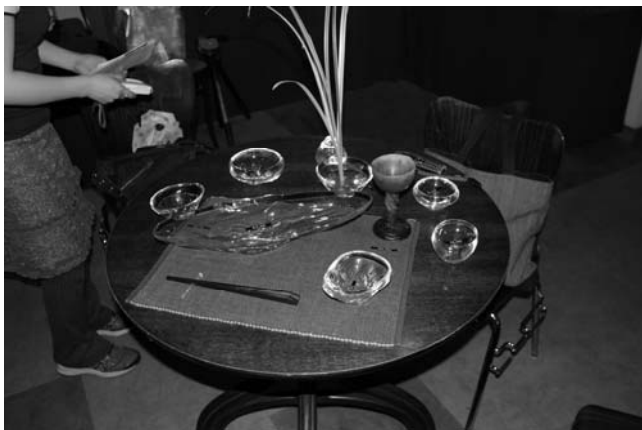
そうめん、ひや汁、薬味、枝豆、ビシソワーズ、、、、！