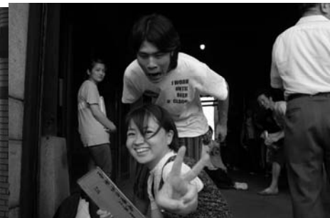
加えられた、ガラスの部分