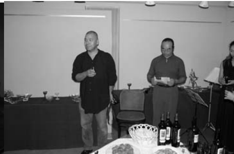
講評会・学生に厳しい質問が飛ぶ