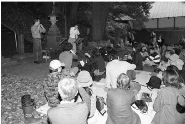
2003年秋 虚空蔵尊境内にてしの笛コンサート