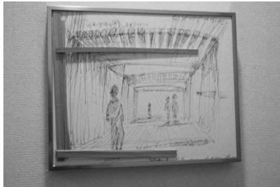
ドローイングを使った作品。