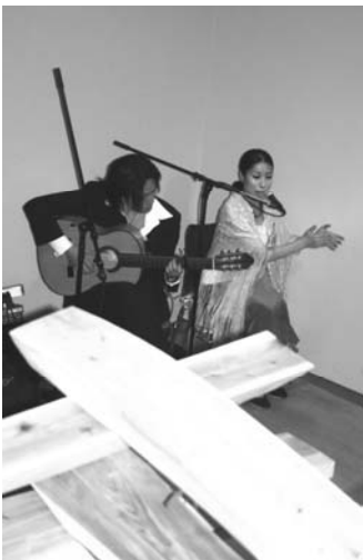
ステキ！ギターとカンテ