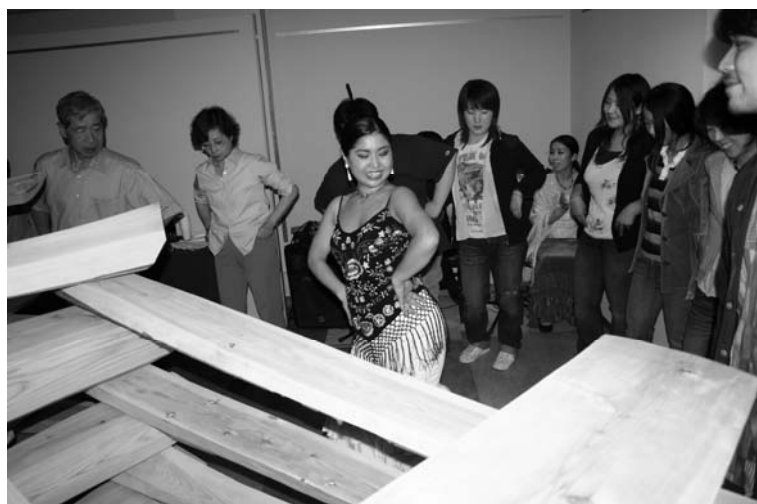
皆で、フラメンコ。 目が回ってしまった～！