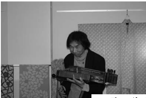
ハーディーガーディー