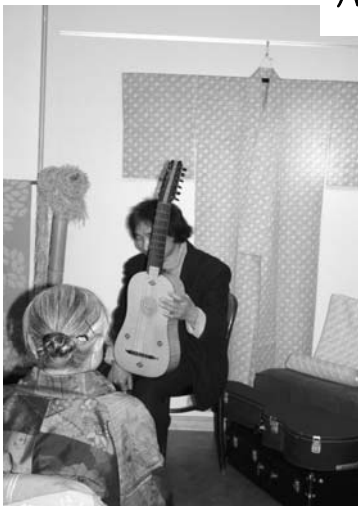
パロック・ギター