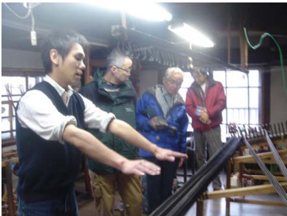
上塩尻、上田紬を伝える小岩井紬工房にて