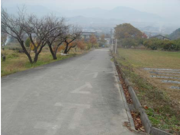
前山寺まえから塩田平を望む

上塩尻では、染めと織りの保存活動をしている市民グループ『絹の郷』のメンバーに、まち案内をして頂きました。