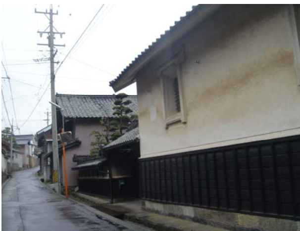
上田市上塩尻の蚕種製造民家が残る北国街道旧道