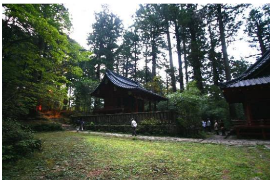
滝尾神社奥の院、左手奥が三本杉