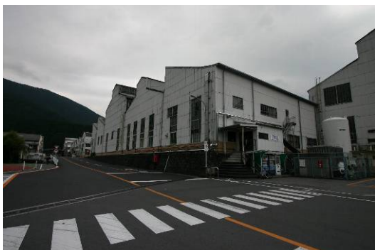
古河電工日光事業所、足尾で精錬された銅がここで精製された