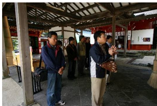
二荒山神社中宮祠にて拝礼、男体山登山道入り口にあたる