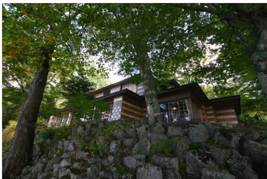
イタリア大使館別荘記念公園を中禅寺湖畔より見上げる

※天平勝宝七年(756)伊豆留(現在の栃木市出流)より補陀落山(二荒山、現在の男体山)を目指し二十六年後の神護景雲元年(767)に登頂成功。そのベースキャンプとして天平神護二年(766)に四本龍寺を建立する。それが勝道上人日光開山の経緯である。日光山一帯は周囲の自然環境とともに、神道・仏教・徳川家墓所の複合した宗教的霊地としての歴史を現在まで継承している。