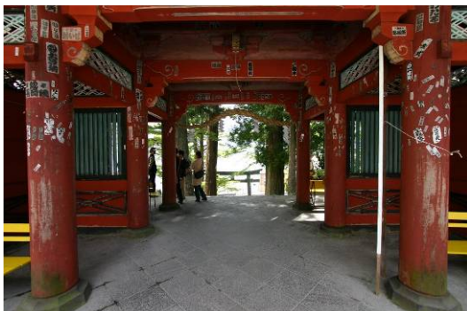
二荒山神社中宮祠の門より鳥居、中禅寺湖を見下ろす