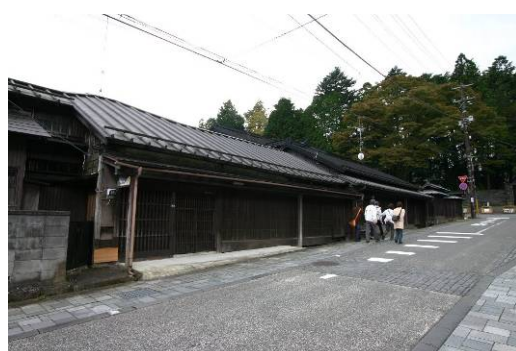
田母沢御用邸前の文化財級の民家、かつての本町の面影を残す