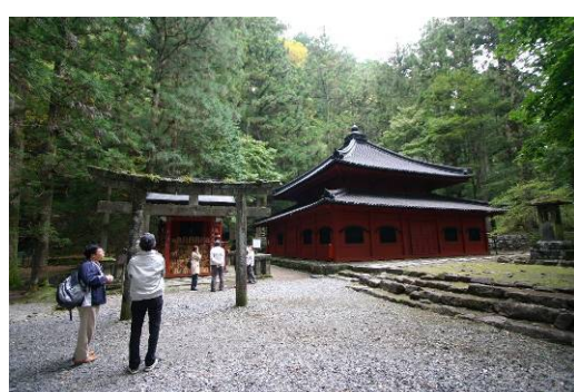
開山堂、裏手に勝道上人と弟子たちの墓所がある