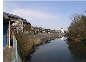
254の南側に平行して流れる槻川