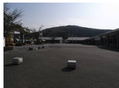
埼玉伝統工芸会館中庭より望む仙元山