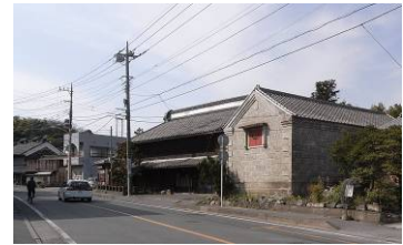
254号線沿いの町並み