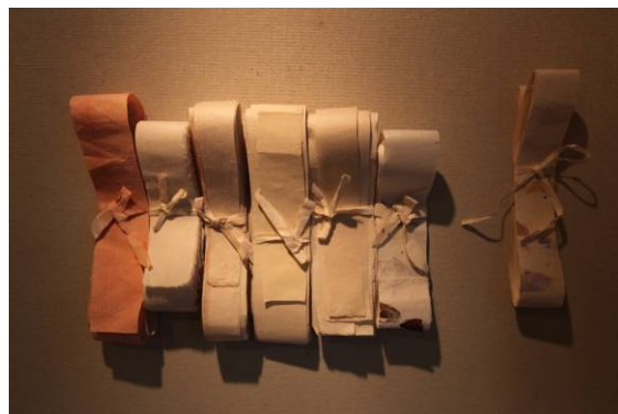
次ページへつづく・・・

「美しい自然の思い出を内面の感性をもって、表現して見た。」と言う、イさんの作品は、韓紙に木版画や、油絵具とアクリル絵具を使用した絵画作品、また、それらを使い構成するインスタレーションです。