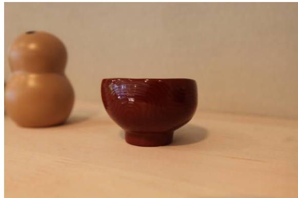
一輪挿しとぐい呑