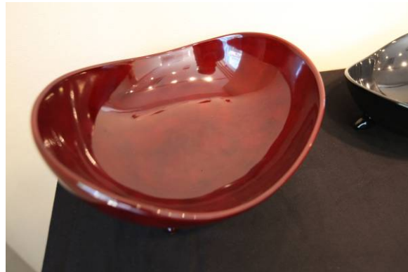
大きなサイズの盛鉢です。

乾漆の歴史は古く遠く飛鳥時代に起こり、天平時代塑像の製作技術として非常に発達した。 乾漆とは麻布を漆で張り固め、必要な厚みの素地をつくる技法のことで、この方法でつくられたものは軽くて丈夫であり、又、自由な造形ができる。 木材でつくられた素地との大きな違いは、長年使用しても乾燥による収縮、変形が生じたり、亀裂が入ったりしない。