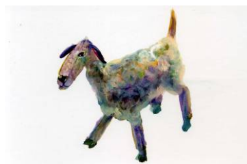
(ドローイング作品)

ギャラリーを一つの空間として捉えて、 インドネシアの「いろ」と「におい」を表現できたらいいと思います。