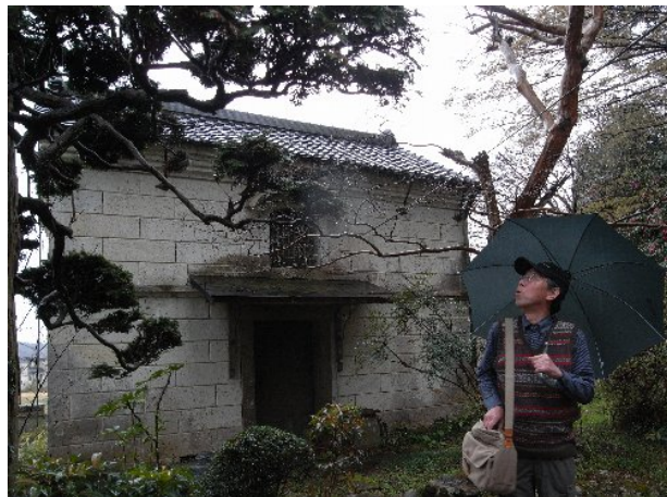
渡辺家 西石蔵(市認定文化財)