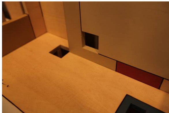
穴あけ部分と色分けされた平面