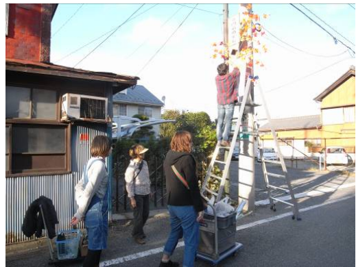
11月4日、東洋大学の学生さん達の協力により、 フラッグ取付け終了しました。

■この事業は、文化庁 平成24年度 文化遺産を活か した観光振興・地域活性化事業 ミュージアム活性化支 援事業 Saitama Art Platform 形成準備事業の一環と して開催されます。織物市場での会場サポートボラン ティア、アートフラッグ設置・撤去ボランティアなど、皆 様のご参加をお待ちしています。